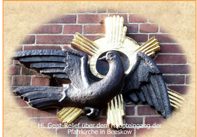
Hl. Geist-Relief über dem Haupteingang der Pfarrkirche in Beeskow

PFARRBLATT | 5. JAHRGANG | 3. QUARTAL 2022