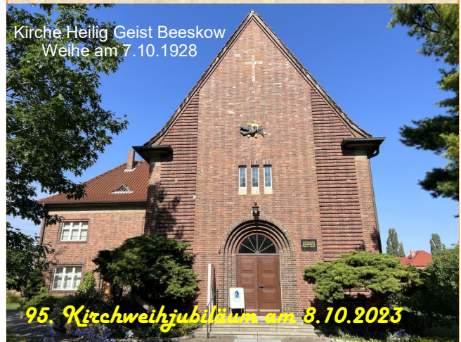
Kirche Heilig Geist Beeskow Weihe am 7.10.1928