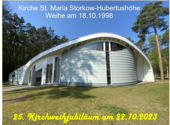
Kirche St. Maria Storkow-Hubertushöhe Weihe am 18.10.1998

PFARRBLATT | 6. JAHRGANG | 4. QUARTAL 2023